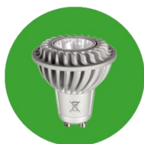
Lampe à LED