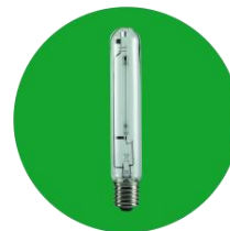
Lampe sodium haute pression